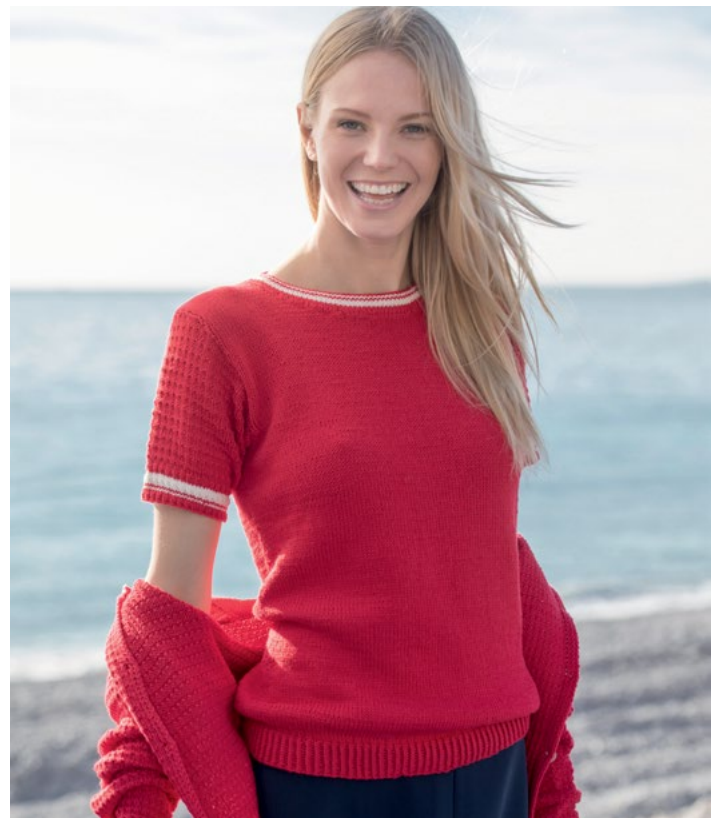
Prøv toppen i rødt | DG 380-13