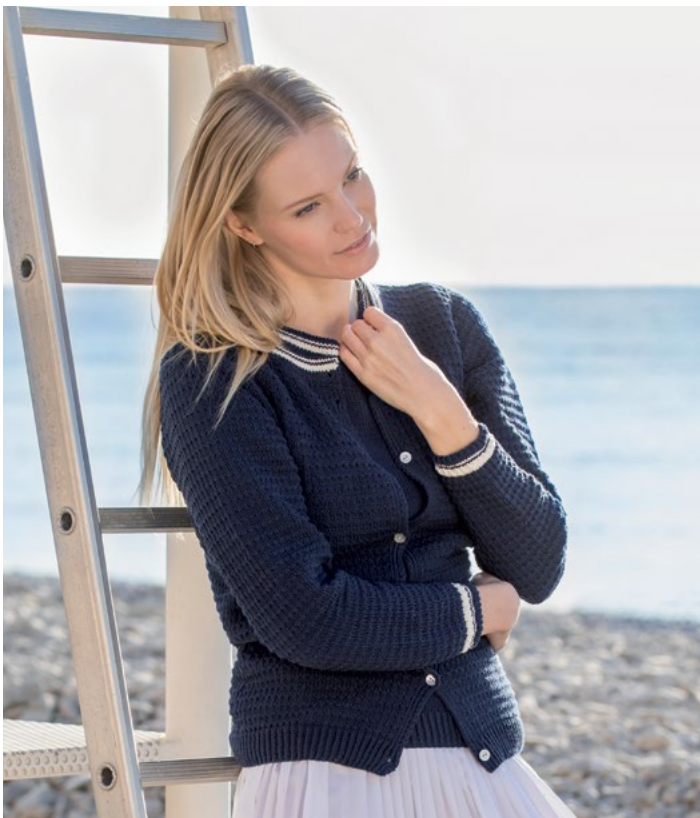
Oppskrift på matchende jakke | DG 380-15