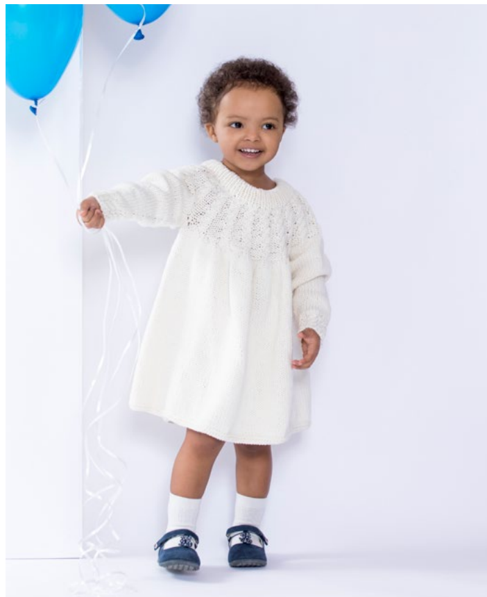
Prøv Ylva flettekjole i hvit | DG387-04