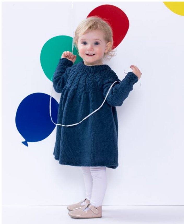
Prøv Ylva flettekjole i marine | DG387-03