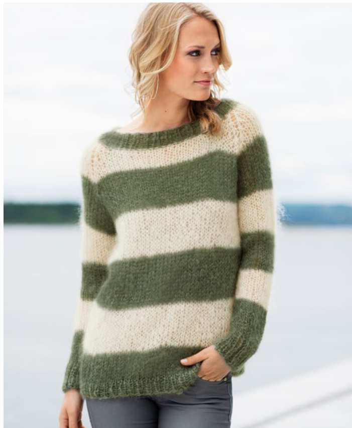
Prøv genseren i natur og armygrønn | DG286-01J