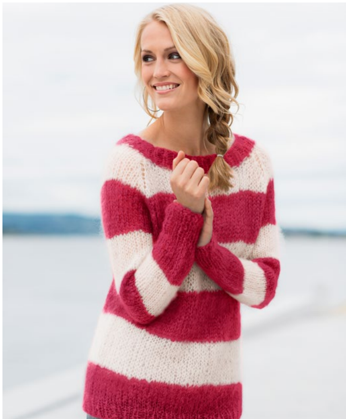
Prøv genseren i hvit og bringebær | DG286-01I