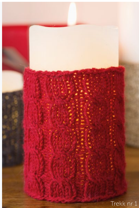
Trekk nr 1

24 m i mønsterstrikk på p nr 4 = ca 10 cm