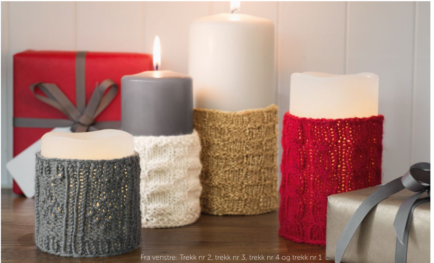
Fra venstre: Trekk nr 2, trekk nr 3, trekk nr 4 og trekk nr 1