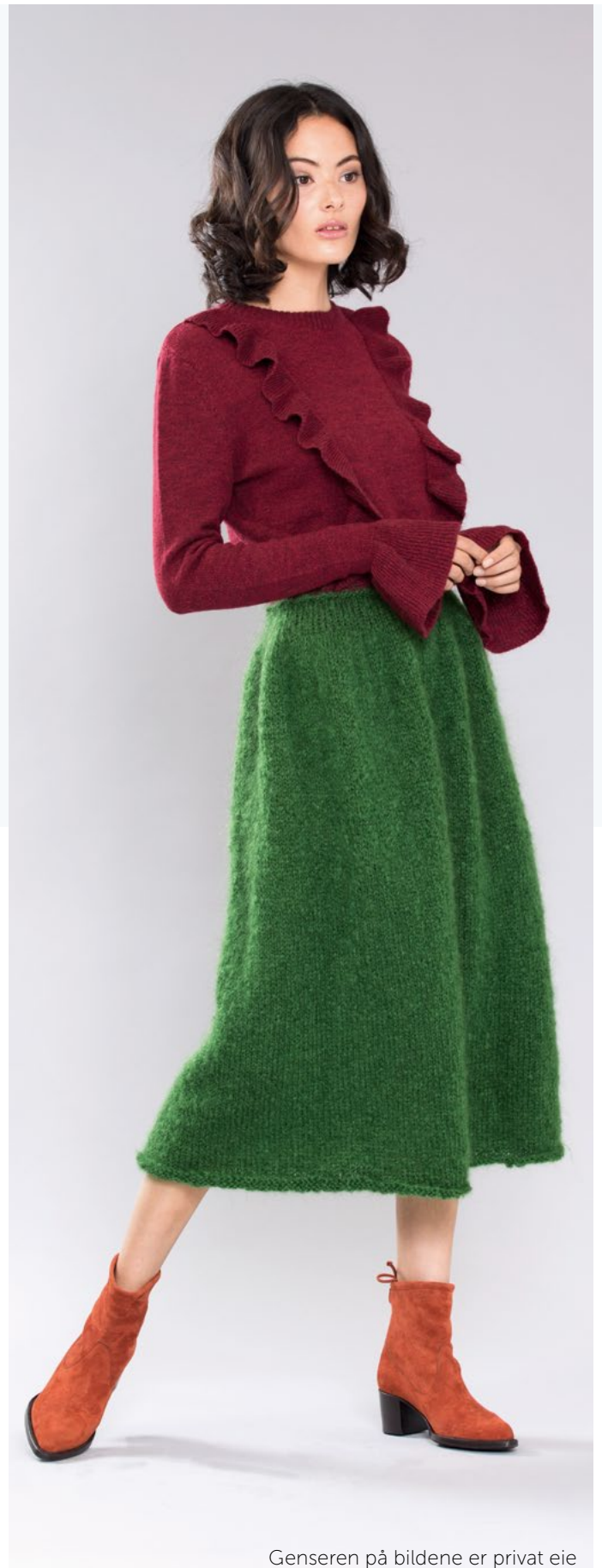
Genseren på bildene er privat eie