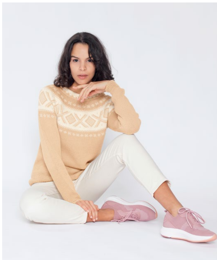
Se også i vanilje | DG410-03