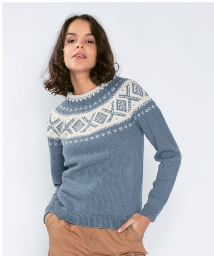
Se også i lys denim | DG410-05