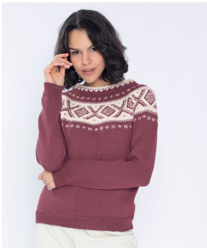
Se også i plomme | DG410-04